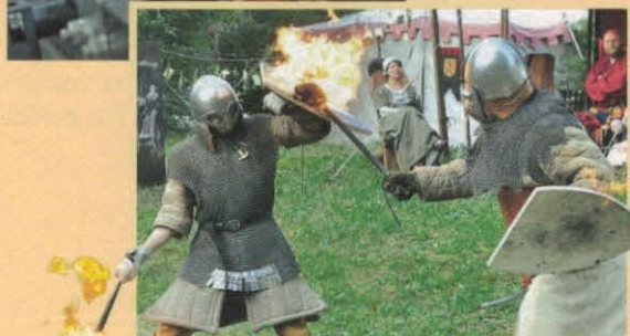
Mittelalterliches Lager auf dem Burghof.

Tag der offenen Tür mit Ulrichsbier-Abfüllung am Sonntag.