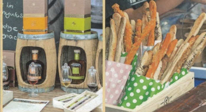
Leckere Produkte aus dem Holzfass